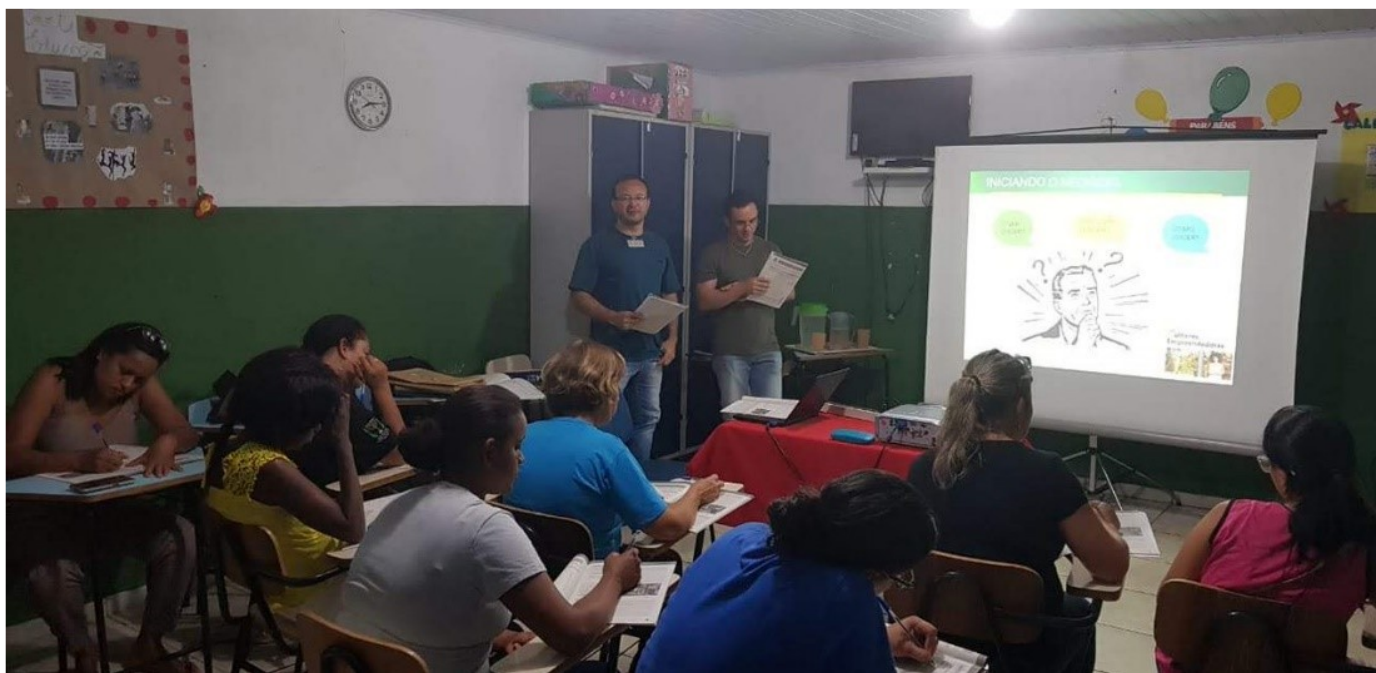
Figura 4 – Foto da ação realizada na cidade de Uberaba