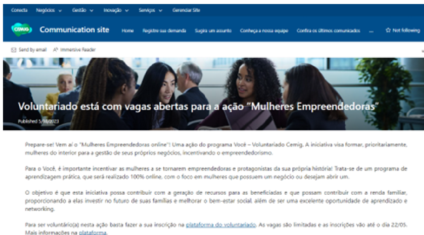
Figura 2 – Imagem da divulgação interna no Cemig onlineApós a inscrição dos empregados para participar da ação, é realizado um treinamento para que os voluntários atuem como instrutores na formação das mulheres. Os voluntários recebem todo o material utilizado durante a formação, bem como todas as orientações necessárias sobre o projeto. Eles podem tirar dúvidas, recebem apoio durante todo o projeto e, ao final da formação, um certificado de participação. Além disso, os voluntários têm a liberdade de compartilhar e complementar qualquer tema abordado com suas experiências pessoais.