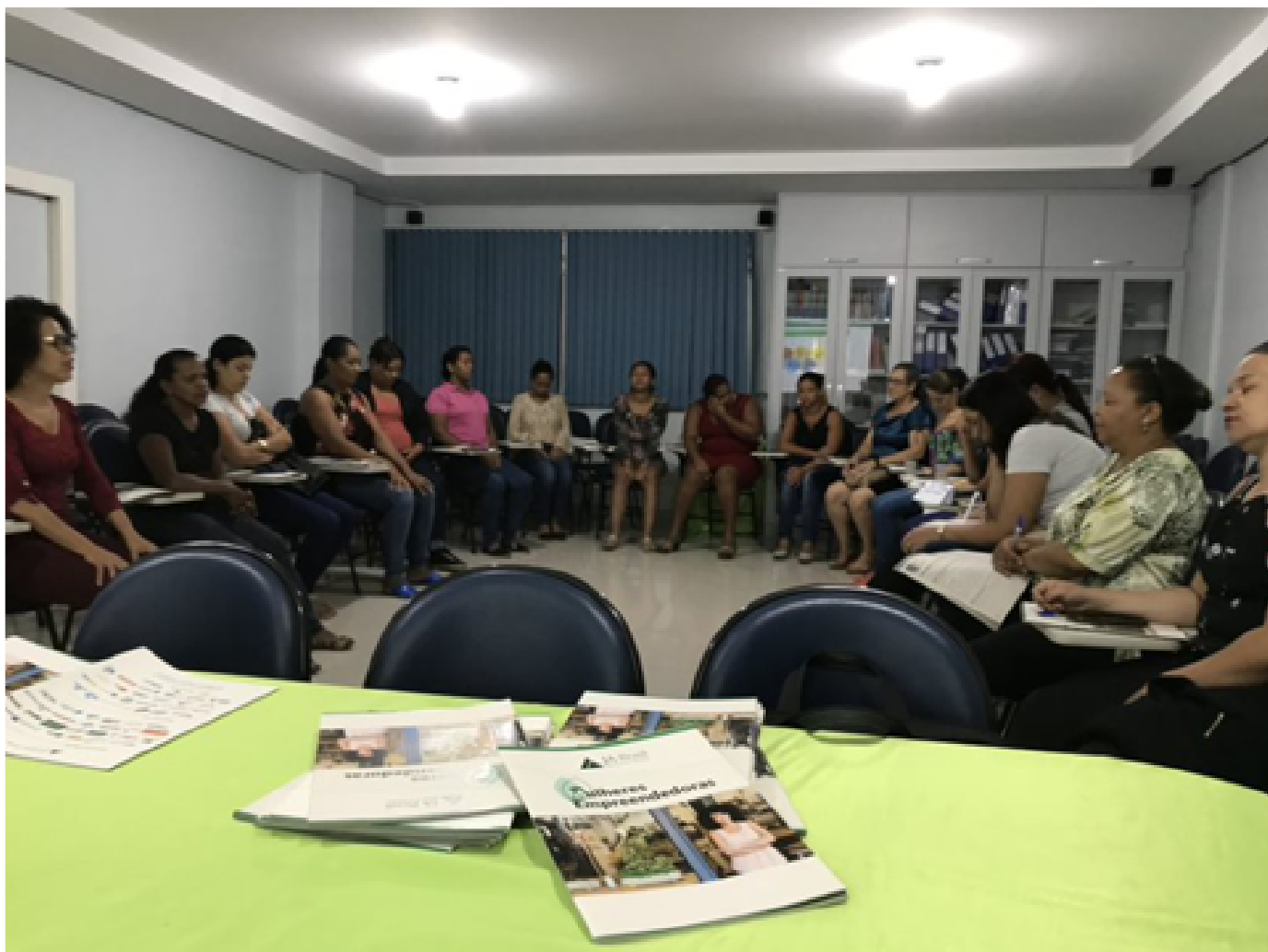
Figura 3 – Foto da ação realizada na cidade de Montes Claros