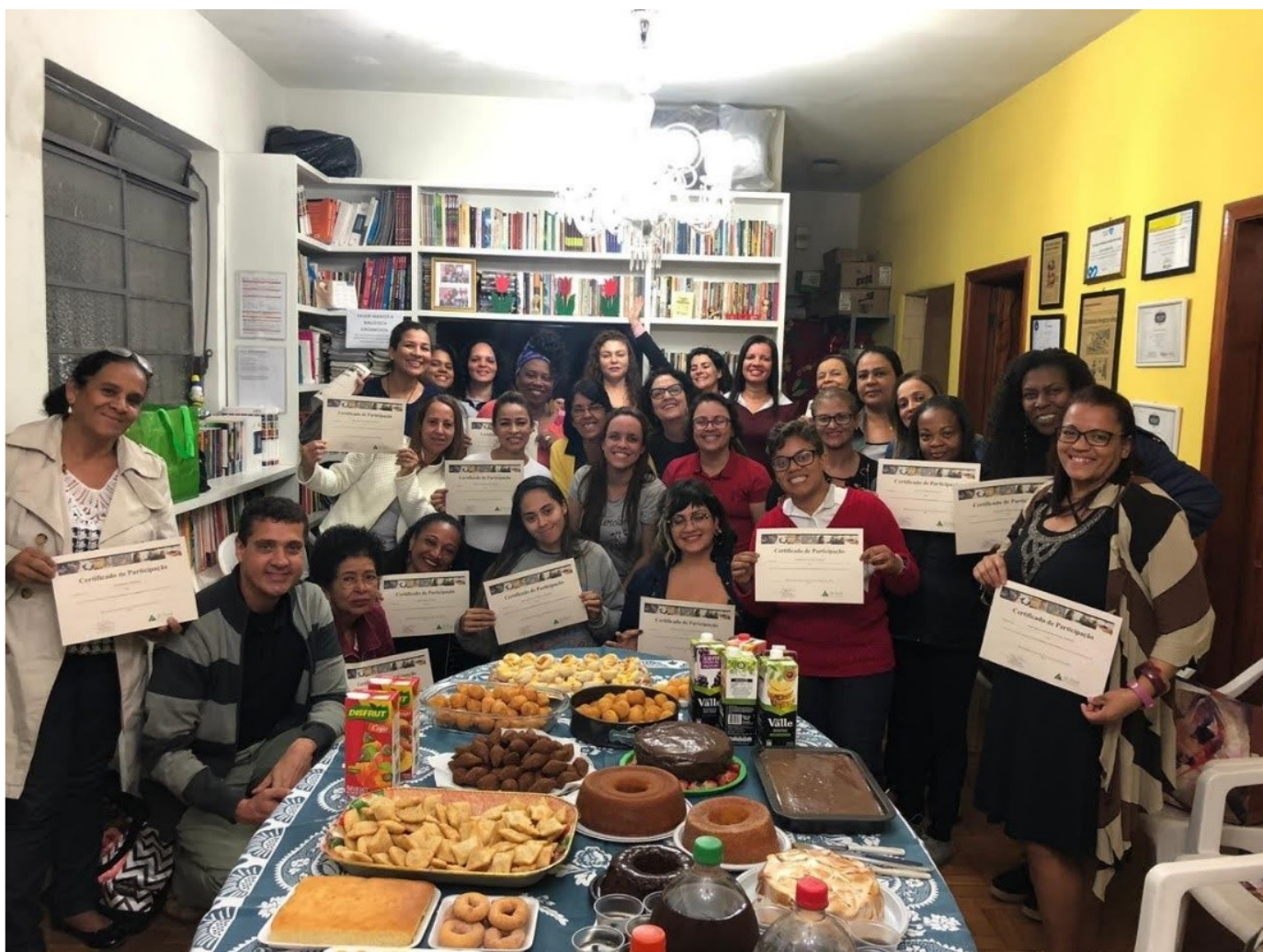
Figura 6 – Foto do último dia de uma ação realizada na cidade de Belo Horizonte