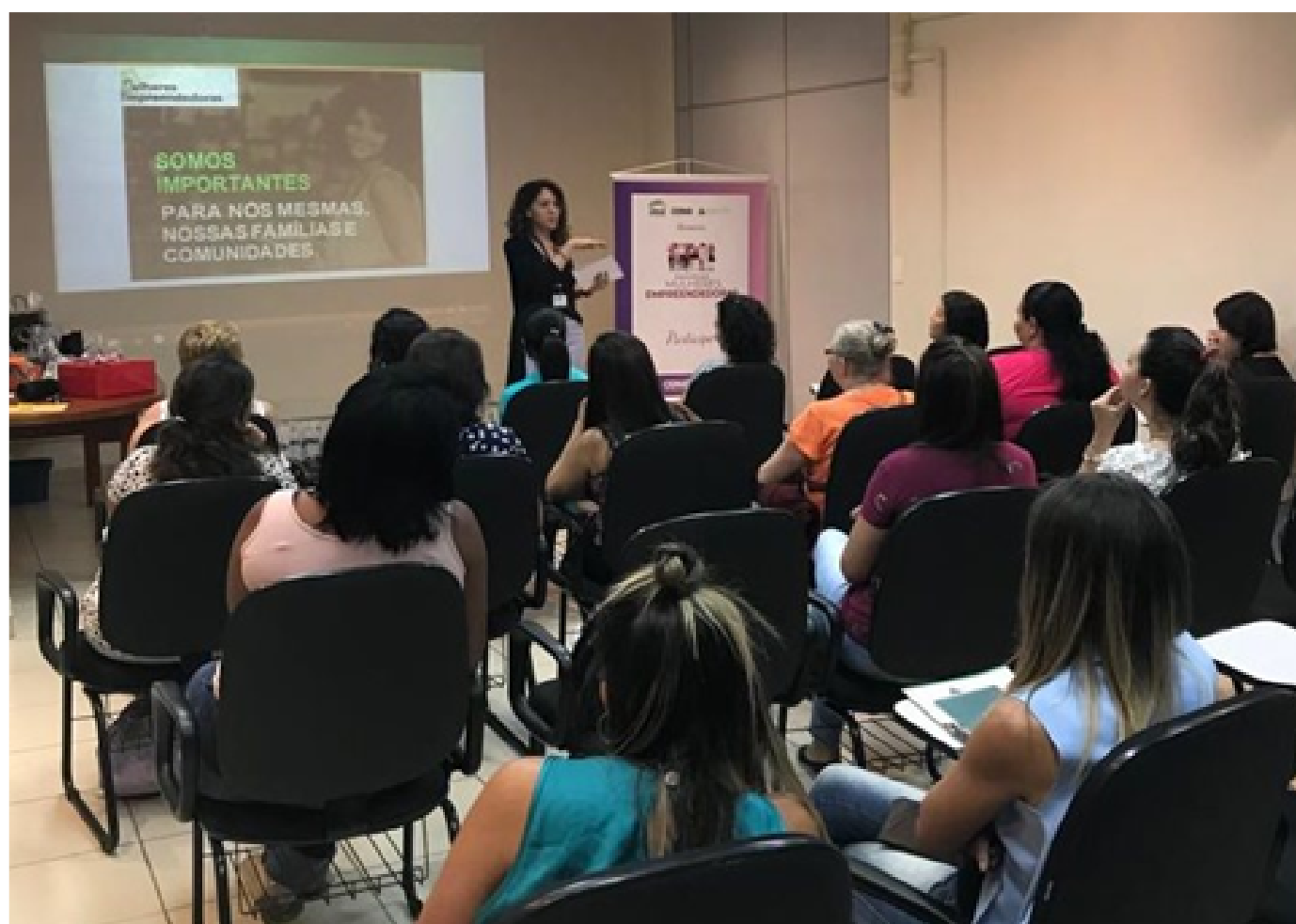
Figura 5 – Foto da ação realizada na cidade de Varginha